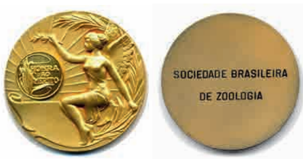
Figuras 6 e 7 – Medalha de Honra ao Mérito (frente verso)