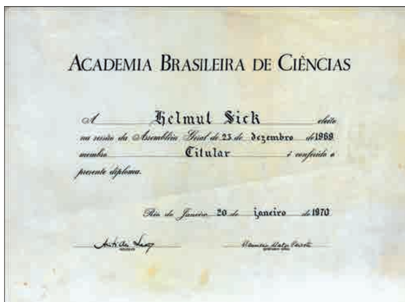
Figura 4 – Diploma de Membro Titular, 1970