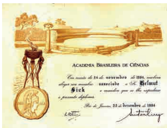
Figura 3 – Diploma de membro associado, 1964