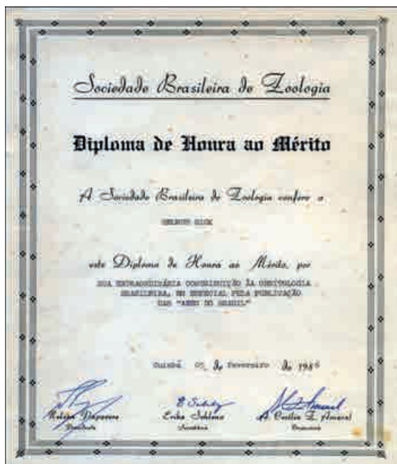
Figura 5 – Diploma de Honra ao Mérito